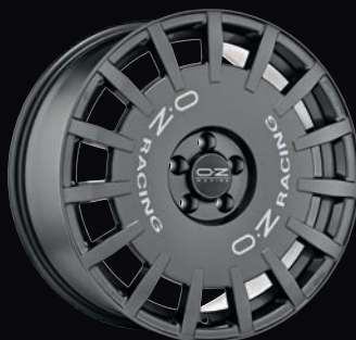
ダークグラファイト