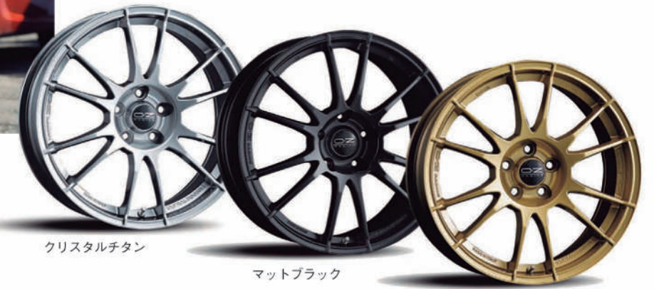
クリスタルチタン