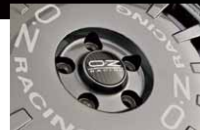
図 オーゼットジャパン tel.053-469-5011 http://oz-japan.com

サイズ: 17×8.0J~18×8.0J 価格: 4万9000円(税別/本)~6万1000円(税別/本) カラー: レースホワイト、ダークグラフィット 適合車種: ・18×8.0J 500X ・17×7.0J (現在開発中)